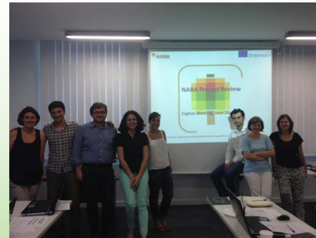
Reunión NARA en Nicosia

El proceso de recogida de encuestas ya ha terminado en todos los países del consorcio (España, Italia, Luxemburgo y Chipre) y al mismo tiempo se está contactando con los grupos interesados en el proyecto y los jóvenes agri-