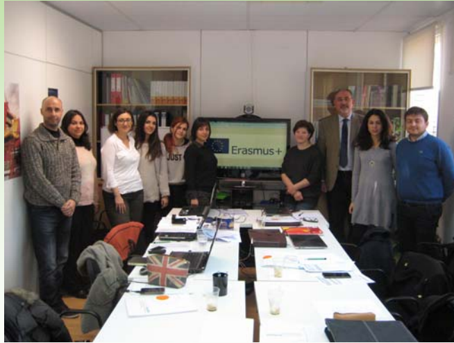
Reunión de lanzamiento del NARA en Zaragoza

La reunión de lanzamiento del proyecto NARA tuvo lugar en Zaragoza los días 5 y 6 de Febrero de 2015 en las instalaciones de la Fundación PCTAD.